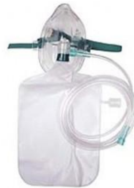
Masque à haute concentration

Il est recommandé d'utiliser des lunettes nasales en première intention. L'interface sera adaptée en fonction des besoins en oxygène et de la tolérance [2].