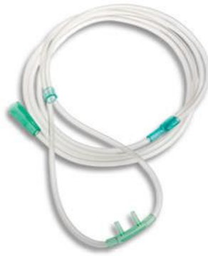
Lunettes à oxygène